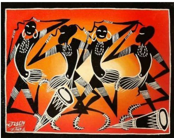
Figura 11: Raffigurazione di danze africane

Durante il rito la paziente viene esposta all’esalazione di fumi prodotti dall’incenerimento di erbe appositamente scelte: questo momento viene accompagnato da una serie di musiche caratterizzate da ritmi molto forti, ottenuti mediante l’impiego di caratteristici tamburi , insieme al battito delle mani e al suono di campanelli, fino a che la donna non comincia a dimenarsi e a piangere.