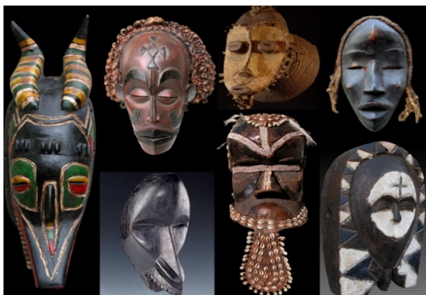
Figura 7: Maschere tradizionali

I feticci sono tra gli oggetti protagonisti dei riti Voodoo , che vengono compiuti sia per motivi sociali/privati sia per attività di guarigione. Per quanto riguarda la sfera sociale e privata possono quindi esplicitare innumerevoli funzioni, come la protezione per la propria famiglia o per un neonato, arrecare un danno fisico ad una persona ritenuta nemica, la propiziazione per favorire il matrimonio e la fertilità.