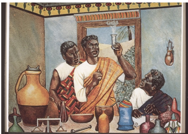
Figura 10: Preparazione di rimedi erboristici

Puoi trattare un mal di denti usando un seme di avocado secco [...] schiaccia il seme fino a produrre una farina fine. Prendi la polvere fine e mettila in bocca e aspetta. Il dolore sparirà dopo qualche tempo [...] Muti wa miago ( Fuerstia africana ) potrebbe essere usato per trattare il mal di denti.