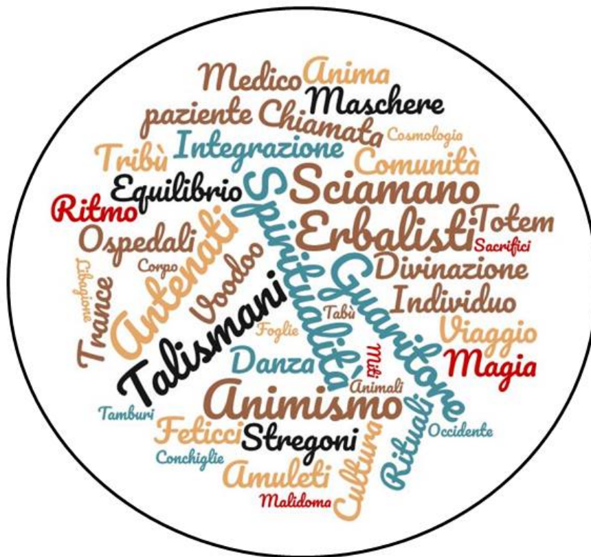
Figura 12: Wordcloud con parole chiave del capitolo

Nella cultura sciamanica africana il termine salute è da ricondurre ad un concetto trasversale di benessere, inteso non solo come corretto funzionamento dei sistemi biologici, ma anche come equilibrio dell'individuo con sé stesso e con la comunità di appartenenza. Di rilevante importanza è inoltre il rapporto che la persona mantiene con il sovrannaturale e con gli spiriti antenati: quest'ultimi fungono da garanti dell'ordine morale e sociale e per tale motivo devono essere venerati e rispettati. La salute è infine il rispetto delle tradizioni e delle regole (tabù) insite nella propria cultura e società.