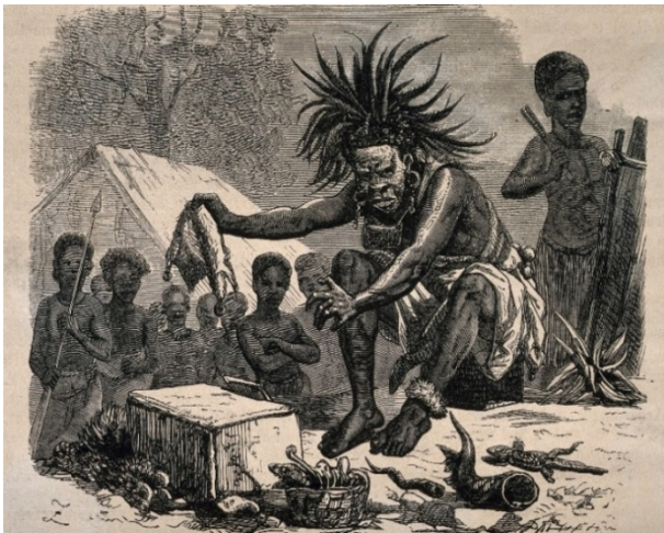
Figura 8: Rituale sciamanico con animali

Presso le tribù nel nord del Ghana è comune offrire animali in sacrificio agli spiriti antenati, specialmente quando un membro della tribù è in punto di morte. In queste occasioni, molti animali vengono sepolti vivi a