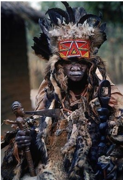
Figura 4: Sciamano africano

Lo sciamanesimo è tra le pratiche spirituali più antiche conosciute dall'uomo; le prime testimonianze, che risalgono ad almeno 30.000 anni fa, sono documentate da pittogrammi e graffiti rinvenuti in varie grotte e su pareti rocciose. Lo sciamanesimo attualmente è diffuso in tutti i continenti presentando caratteri distintivi ben precisi e comuni a diverse culture (Fornara, B., 2017).