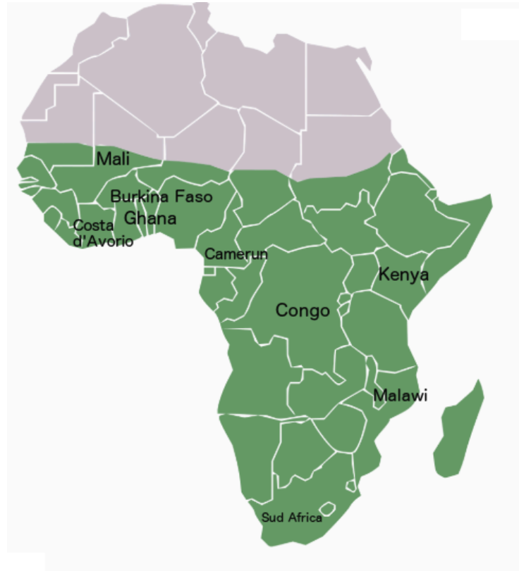
Figura 1: Africa subsahariana, nel dettaglio gli Stati che verranno trattati nel capitolo

L'Africa si presenta come un grande continente, popolato da 800 milioni di persone, in cui si intrecciano molteplici gruppi etnici, culturali e linguistici, ognuno con le proprie peculiarità.