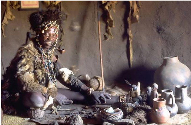
Figura 9: Rituale della divinazione

Il malato si lamenterà di dolori articolari, mal di testa e talvolta vertigini, vomito, diarrea, brividi e talvolta febbre [...] Uso i prodotti estratti dall'albero Neem ( Azadirachta indica ndr).