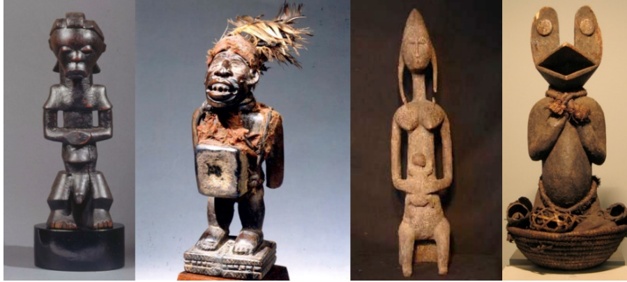
Figura 6: Feticci per riti Voodoo

La cultura africana profondamente animista, riconosce in amuleti o talismani ( gris gris o juju nella lingua locale) oggetti consacrati che permettono all'uomo di comunicare con il mondo sovrannaturale. Essi sono costituiti di svariati materiali che spaziano da erbe medicamentose a frammenti animali (unghie, becchi, corna...), conchiglie, gocce di saliva, confezionati in sacchetti di pelle, cuoio o tessuto e indossati come bracciali, cinture o collane. Da non trascurare anche il ruolo del feticcio , statuetta di legno o argilla, di varie fattezze, inclusa quella umana, semplice o adornata di chiodi, piume, fango, foglie masticate, brandelli di pelle animale, ossa... al cui interno si ritiene risieda uno spirito ( djinns ). Questi spiriti sono di varia natura, possono popolare i regni della terra, dell'aria, del fuoco e dell'acqua. Quanto più il feticcio viene adorato e onorato con sacrifici, tanto più esso diviene potente e a sua volta conferisce potere a chi lo possiede. Il feticcio richiede il rispetto di regole precise, come ad esempio riporlo in una stanza specifica, proteggerlo dallo sguardo femminile, ripararlo dalla luce del giorno o della luna, in quanto un comportamento sbagliato può ritorcere la sua forza contro lo stesso proprietario.