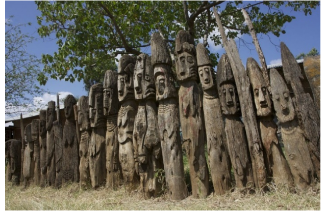
Figura 3: Totem africano

Il tabù è un'interdizione sacrale relativa ad un totem , considerato oggetto di riverenza e devozione che i componenti di uno stesso clan non possono cacciare, danneggiare, consumare o nominare. Tra gli esempi di numerosi tabù presenti in Africa, vi è quello di coloro che portano il cognome "Coulibaly" in Africa occidentale, inerente al divieto di mangiare il pesce siluro. La sacralità di questo pesce è da ricondurre alla leggenda dei due fratelli Coulibaly originari del nord della Costa d'Avorio, ovvero i fondatori dei regni Bambara, i quali fuggendo da alcuni assalitori tentarono di risalire il fiume Niger aggrappandosi al dorso di un pesce siluro che li trasportò sani e salvi sull'altra riva, assicurando loro la sopravvivenza della stirpe (Cocconcelli, L., 2014).